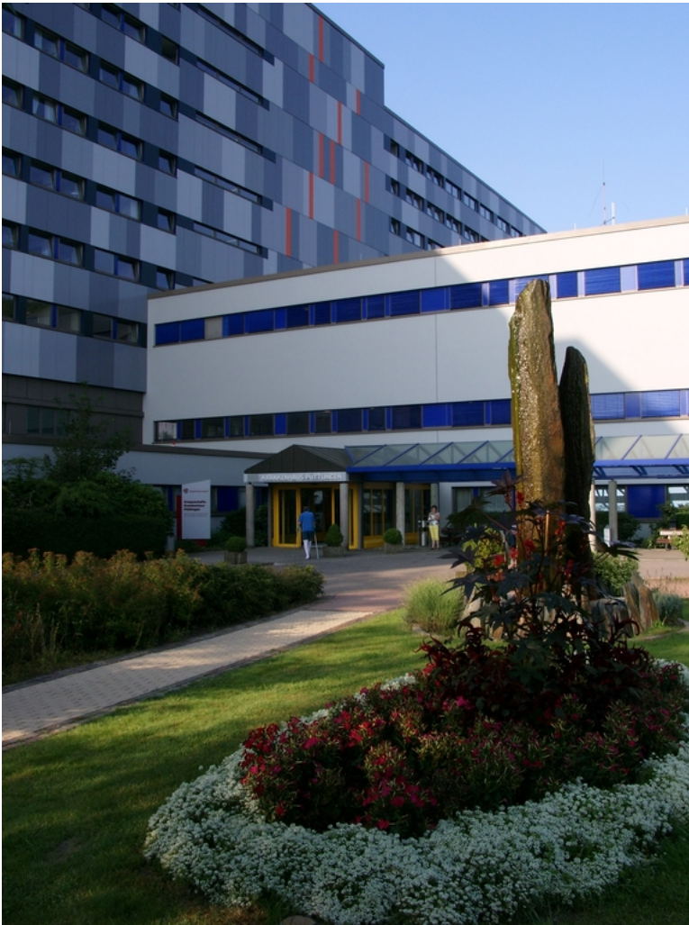
Abbildung: Krankenhaus Püttlingen, Eingangsbereich